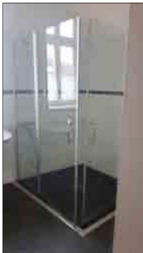
2-Raum-Wohnung „Herrenhaus“ - Badezimmer