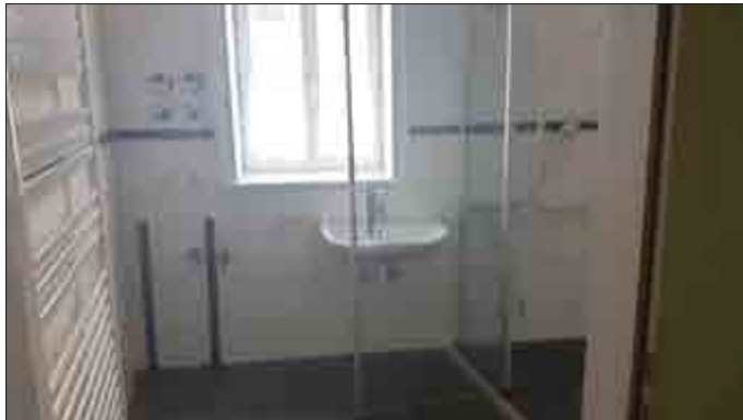
2-Raum-Wohnung „Herrenhaus“ - Badezimmer

Um die Wohnung an die individuellen Einschränkungen besser anzupassen, ist oft kein großer Umbau nötig. Häufig genügen kleine Veränderungen der Einrichtung. Einfache, praktische Vorrichtungen und pfiffige „Alltagshelfer“ können es den Hilfebedürftigen wesentlich erleichtern, weitgehend selbstständig zu wohnen und ihren Haushalt zu führen. Schon das Umstellen einzelner Möbel kann helfen, dass Utensilien wieder leichter erreichbar sind. Das Beseitigen von Stolperquellen und Hindernissen aber auch der Einsatz von Haltegriffen kann den Alltag sicherer und bequemer