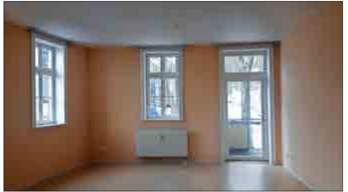
2-Raum-Wohnung „Herrenhaus“ - Wohnzimmer

*sehr schöne behindertengerechte 2-Raum-Wohnung im „Herrenhaus“ 64,00 qm mit Balkon, ab 01.09.2017 zu vermieten.