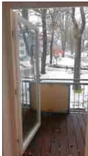
2-Raum-Wohnung „Herrenhaus“ - Blick vom Balkon